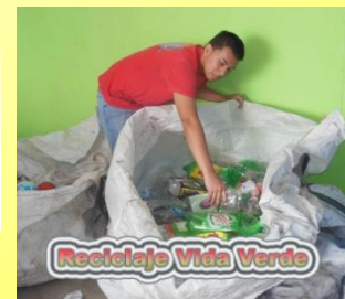
Reciclaje Vida Verde

Återvinningscentrat Vida Verde - Grönt liv har alltsedan starten erbjudit återvinningstjänst till besökarna vid den ekologiska marknaden el Trueque. Besökarna har här upptäckt en möjlighet att bidra till miljövården.